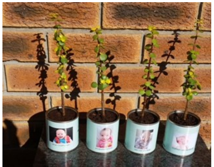
Die NG-Gemeente Kenridge gee spekboomplantjies vir elke kindjie wat gedoop word.