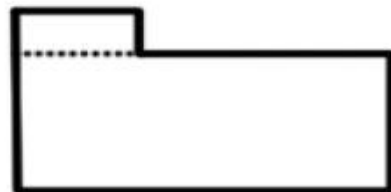
Patroon vir tand